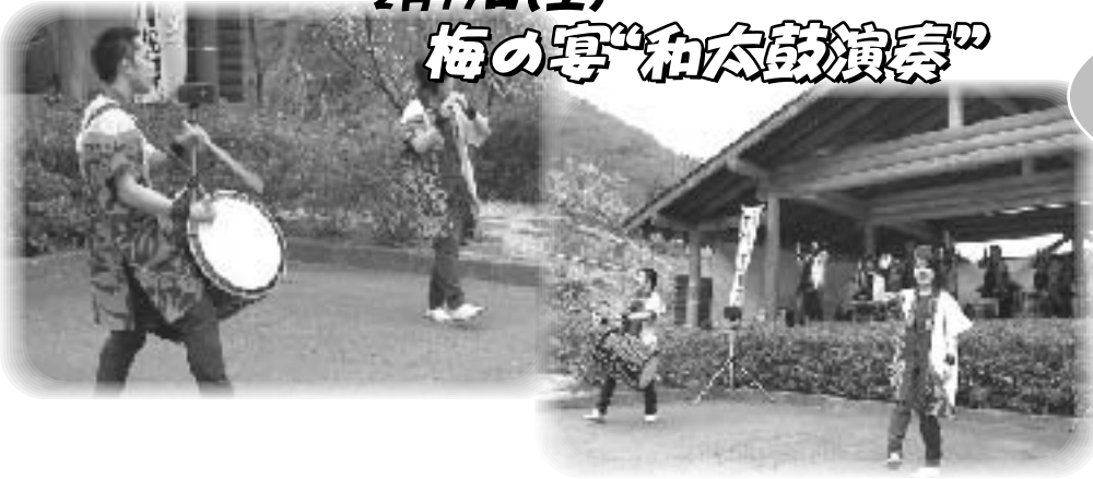
相洋高校和太鼓部