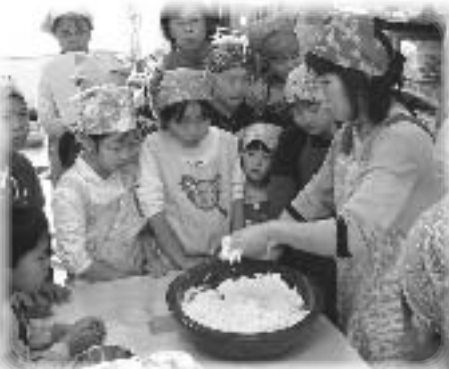
“親子でうどん作り”