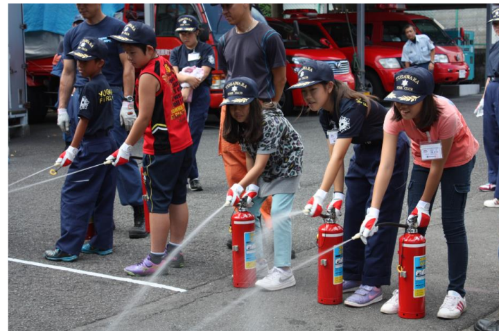
消火器の取扱い訓練