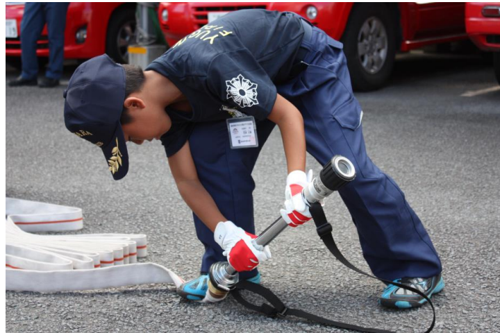
軽可搬ポンプの取扱い訓練

今後、活動の一環として定期訓練を計画中です。来年の出初式では、町民の皆さんに披露する予定です。