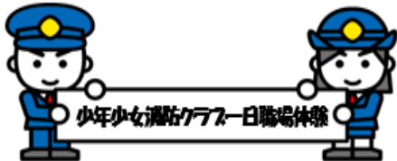
少年少女消防クラブ 一日職場体験

平成26年8月6日(水)から8日(金)までの3日間、少年少女消防クラブでは、38名のクラブ員が3グループに分かれて午前9時から午後4時まで1日職場体験を行いました。