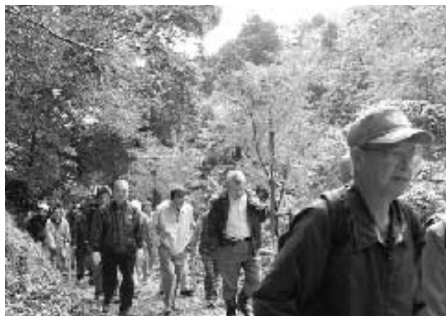
もみじの郷までハイキング