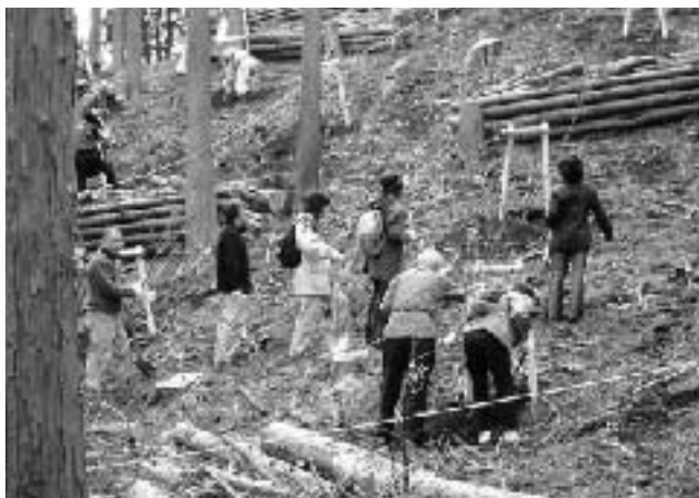
参加者による植樹