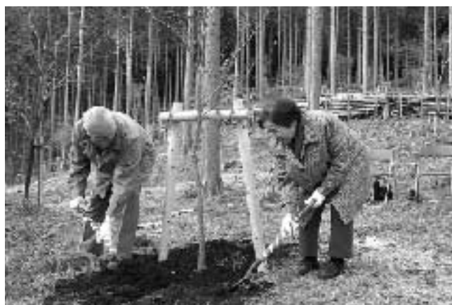
金婚式ご夫妻による記念植樹