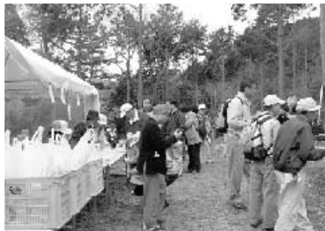
植樹祭を終えおいしいとん汁をいただきました