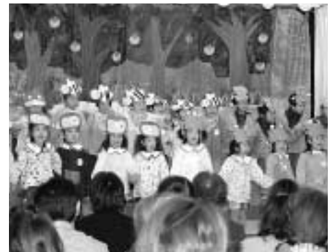
「みやのうえ保育園」