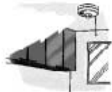
異常発生を警報音やメッセージで知らせます。