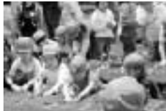
「土にふれあう園児のつどい」 おいしいおいもになあれ!