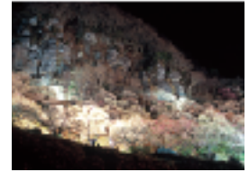
「梅林ライトアップ」 幻想的...