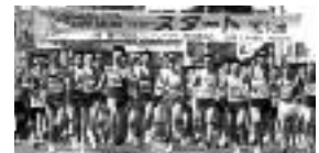
「湯河原温泉オレンジマラソン」 目指すは入賞!