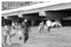
「クリーン&グリーン大作戦」 きれいにするって気持ちいい!