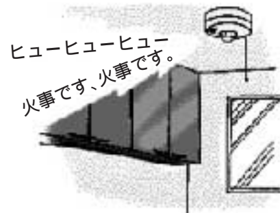
異常発生を警報音やメッセージで知らせます。