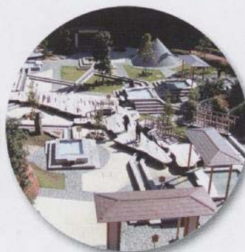
万葉公園足湯施設「独歩の湯」