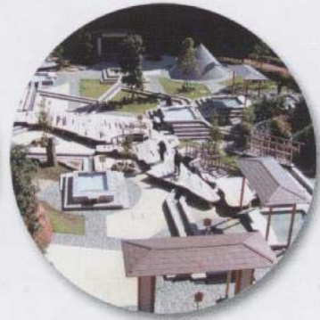
万葉公園足湯施設「独歩の湯」