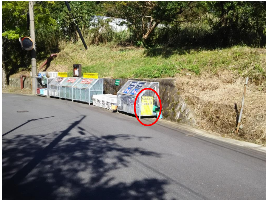
写真（看板設置箇所）