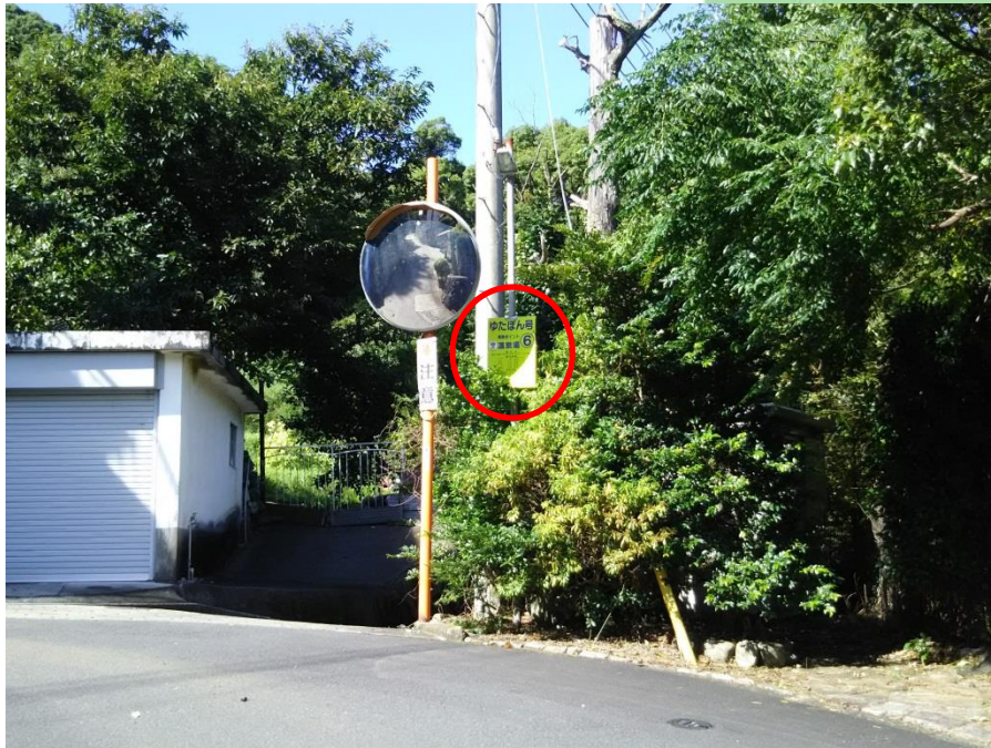
写真（看板設置箇所）