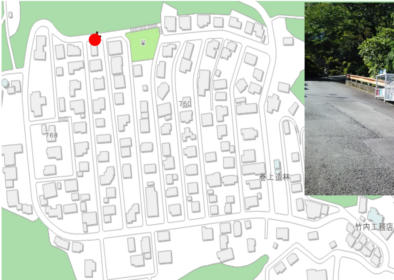
写真（看板設置箇所）