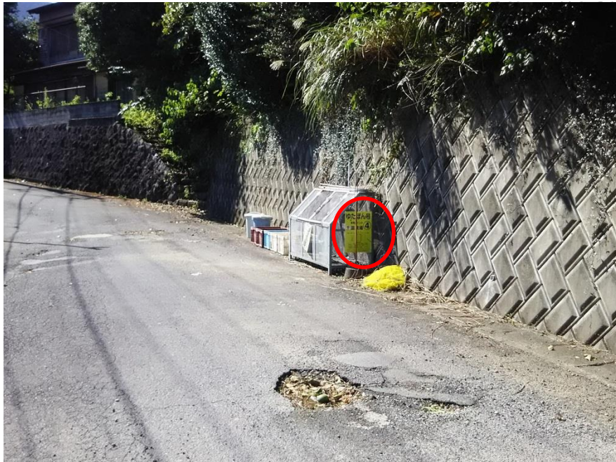
写真（看板設置箇所）