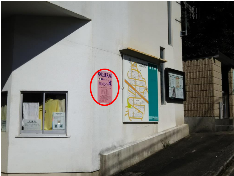
写真（看板設置箇所）