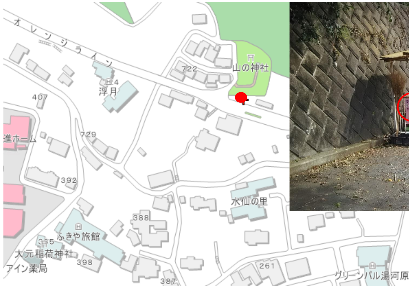
写真（看板設置箇所）