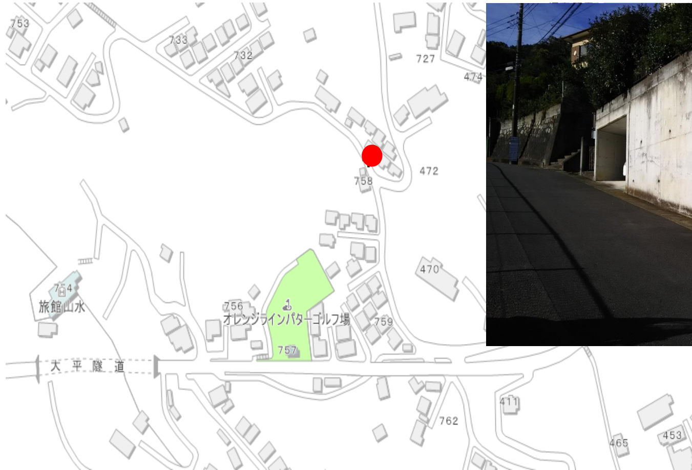
写真（看板設置箇所）