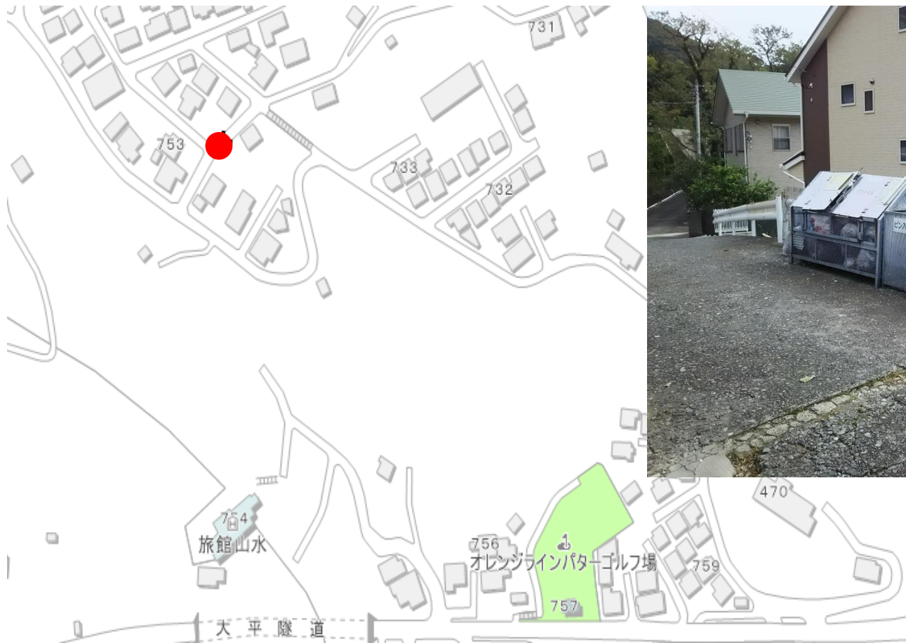
写真（看板設置箇所）