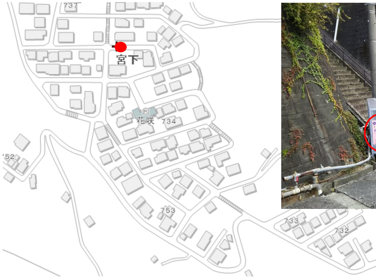
地図（乗降ポイント）