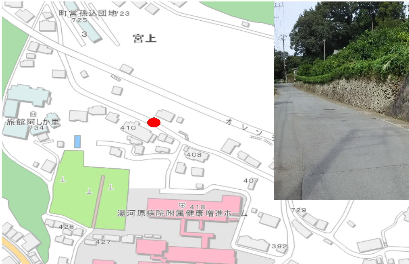
写真（看板設置箇所）