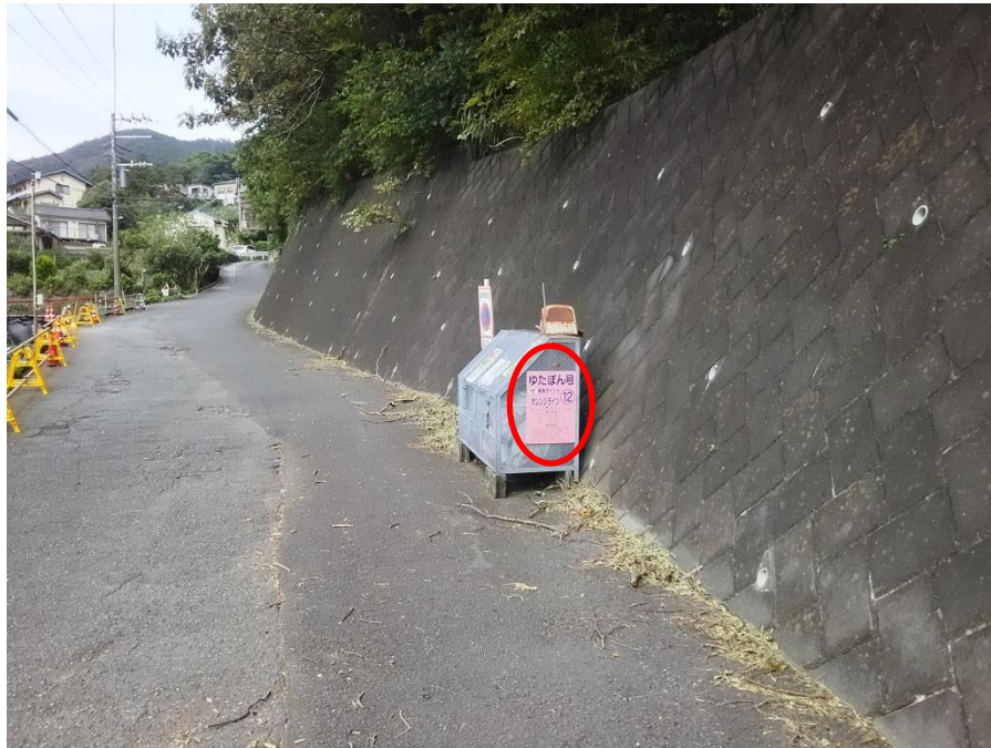
写真（看板設置箇所）