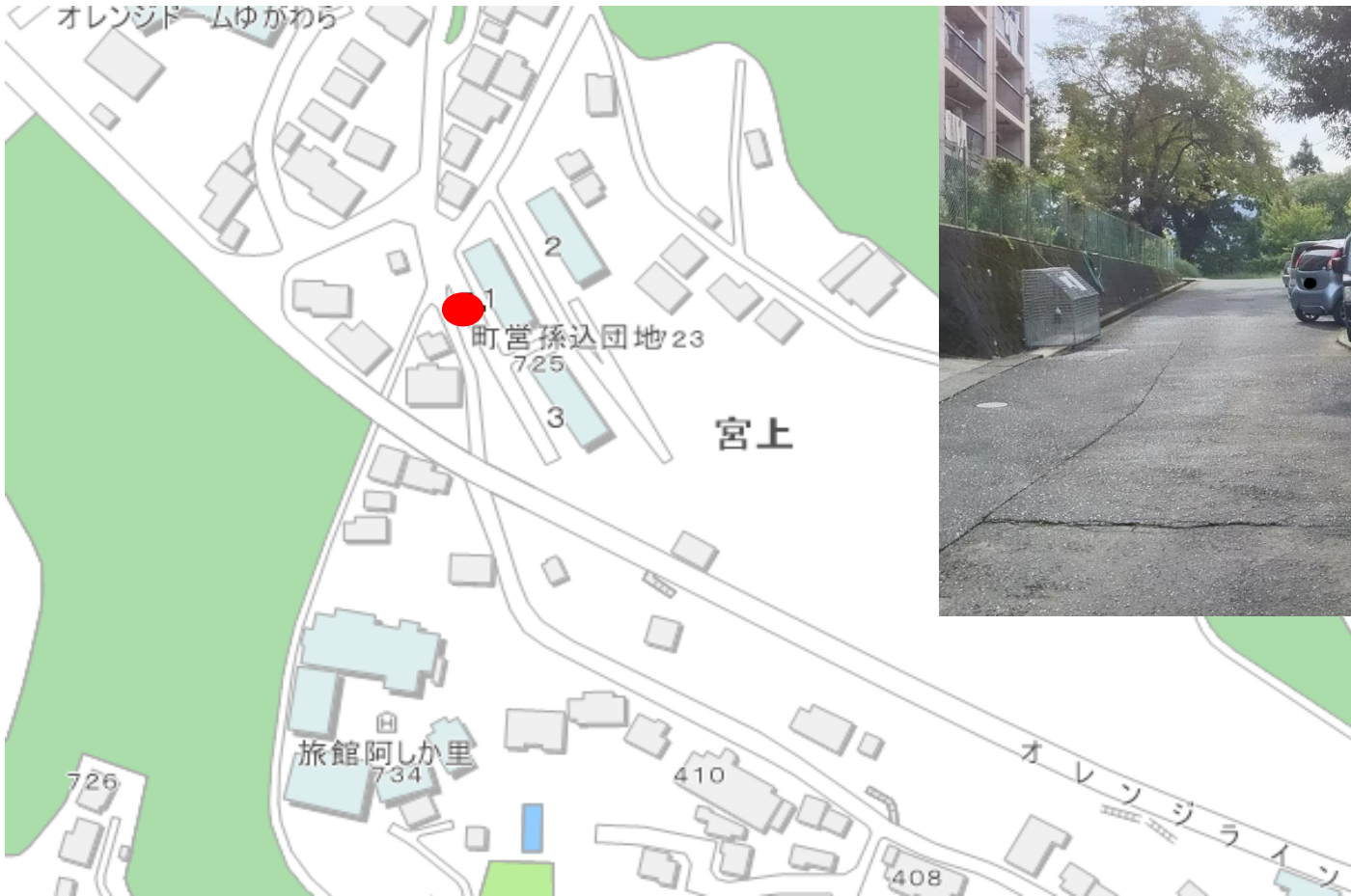
写真（看板設置箇所）