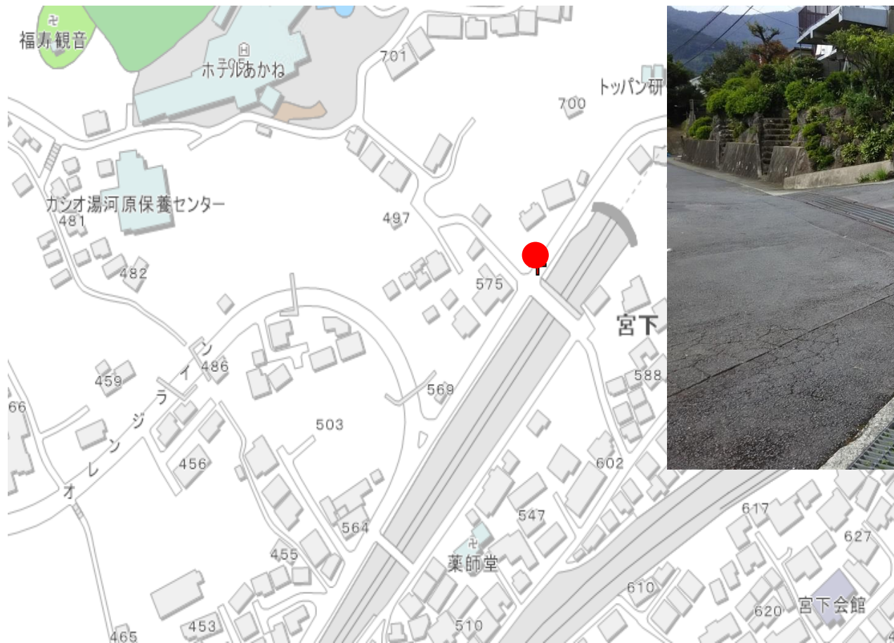
写真（看板設置箇所）