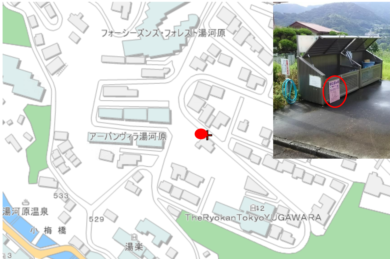
写真（看板設置箇所）