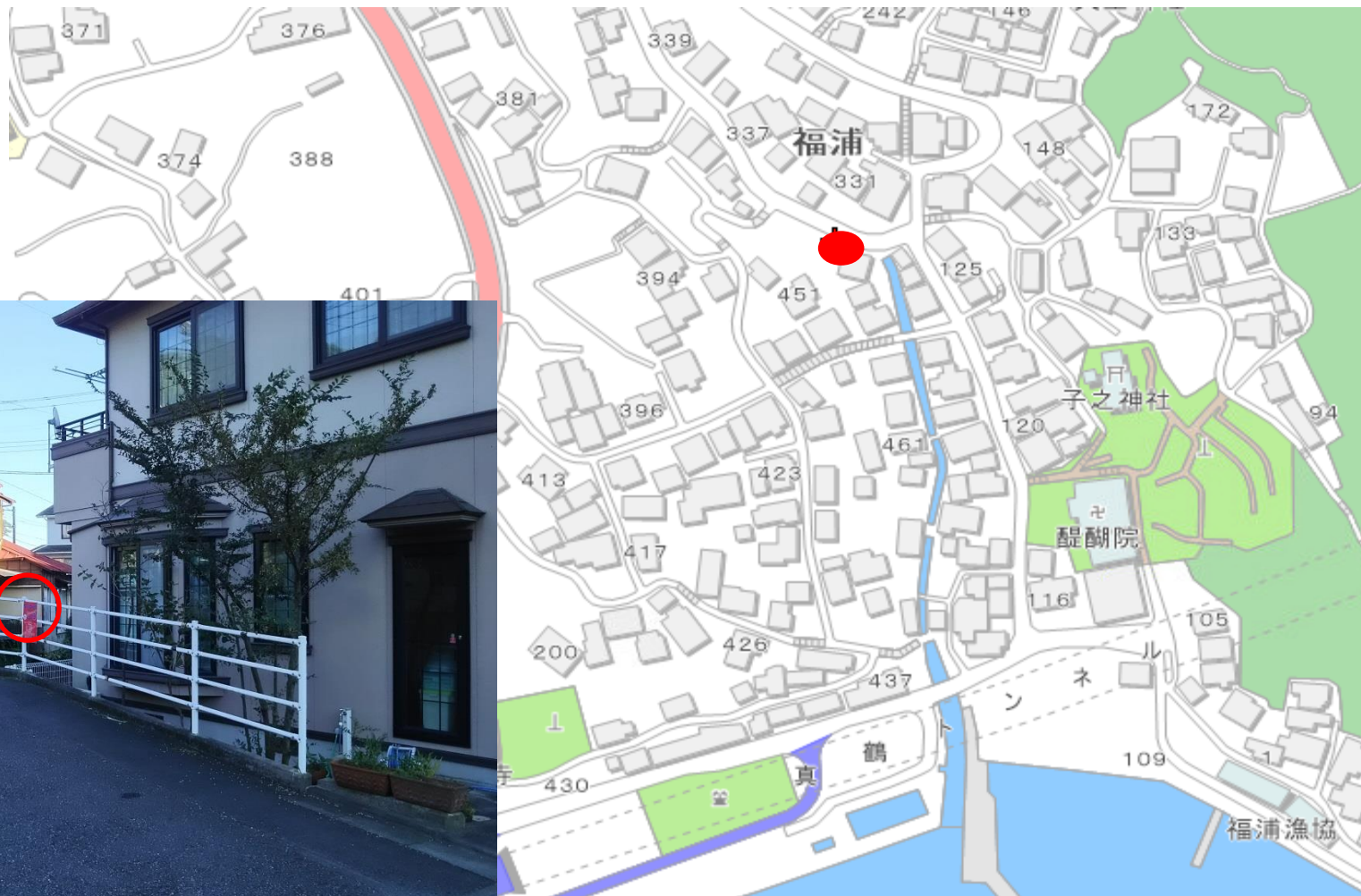
写真（看板設置箇所）