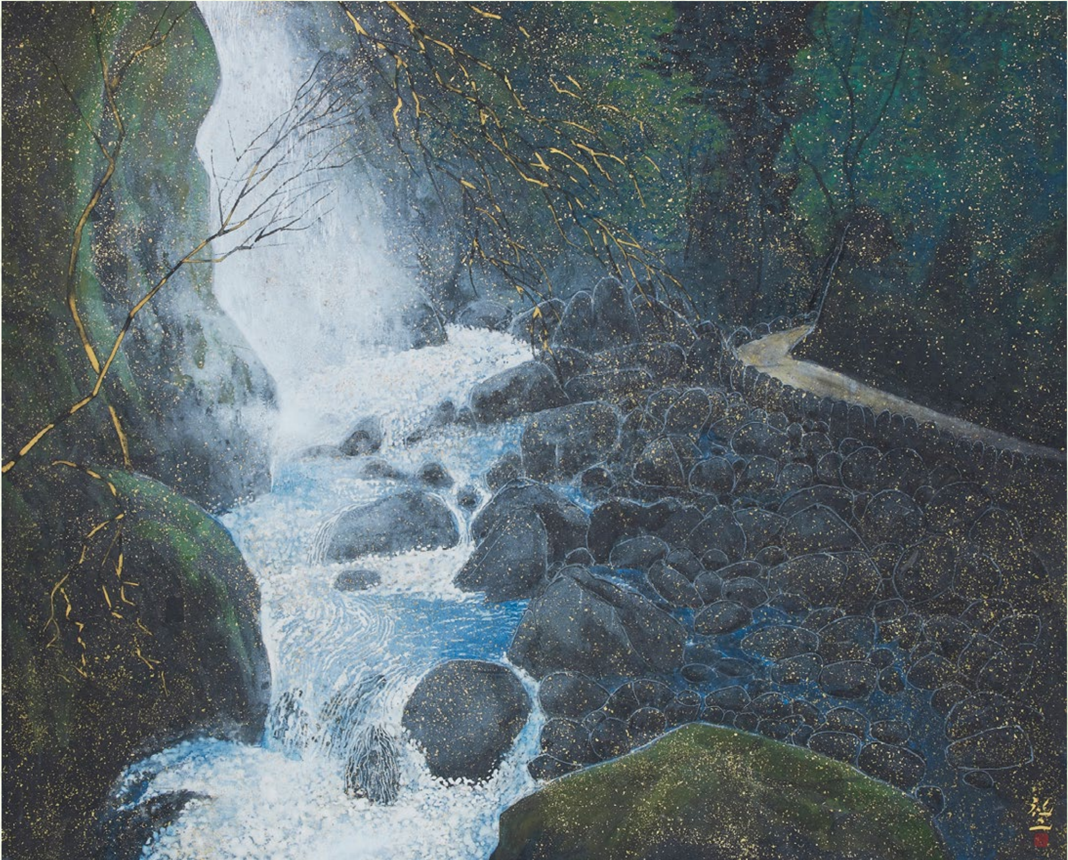
平松礼二「雨後・万葉小径」