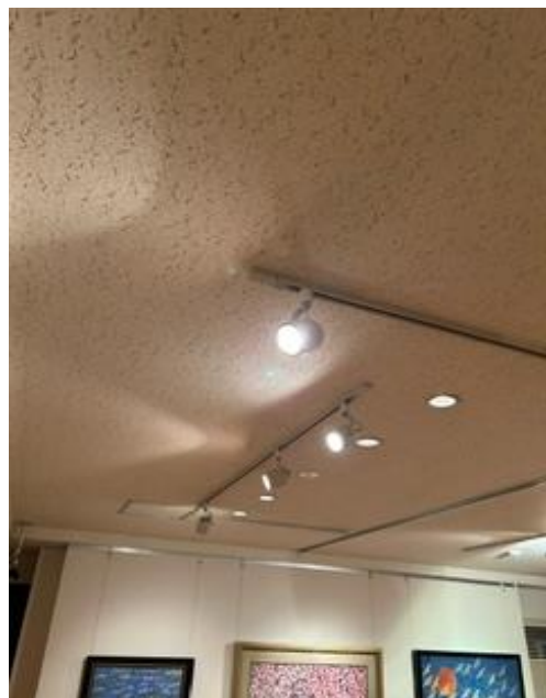
⑰展示室 3、4、5 スポットライト