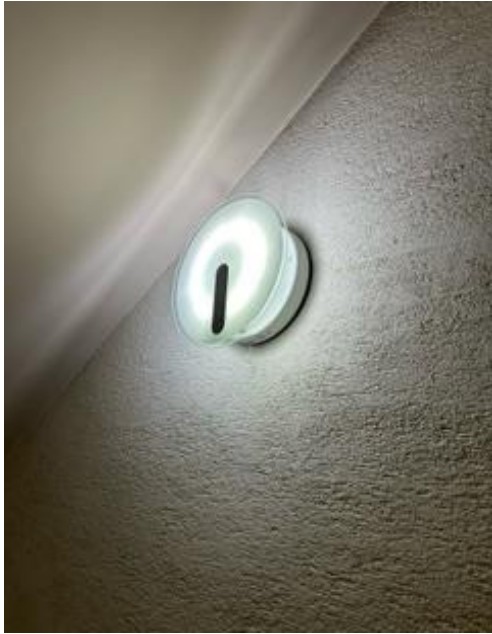
②⑨ 平松階段非常灯 サ-川型