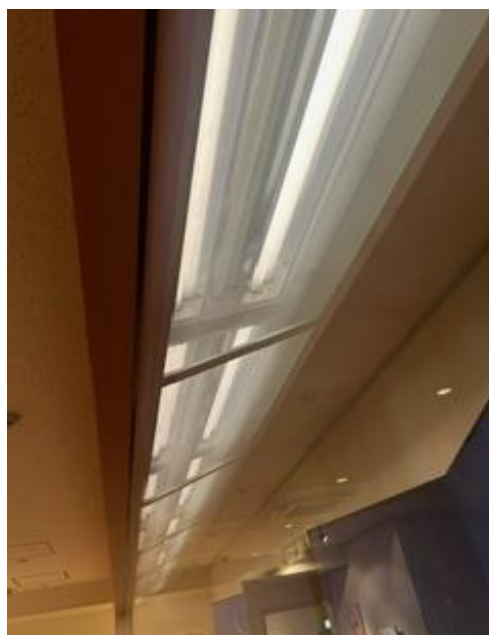
⑱展示室 4 展示ケース