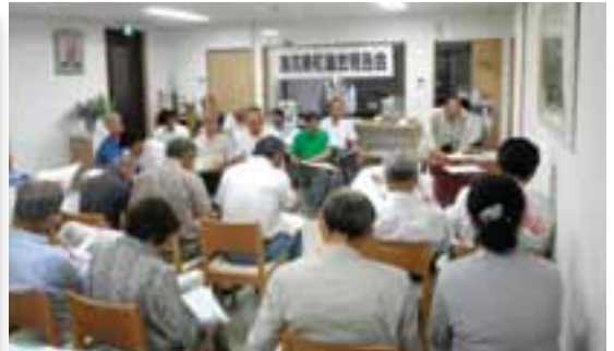
平成26年6月26日 たんぼぼ作業所で開催した議会報告会の様子