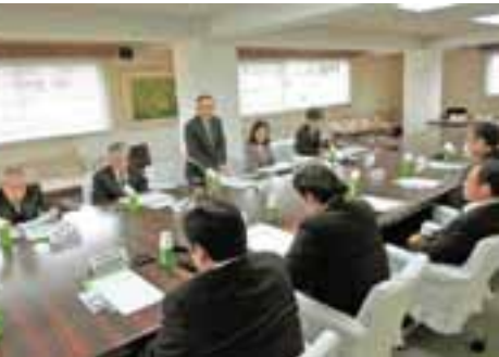
平成27年1月29日 湯河原町社会福祉協議会との一般会議の様子

議長に開催のお申込みがあった場合、議長の諮問機関であります「議会運営委員会」において、開催する必要があるかどうかを協議し、開催を決定させていただきます。 なお、お申込みに当たっては、日程の調整や会場の都合などがありますので、事前に議会事務局までご連絡ください。 なお、平成26年度は3回の一般会議を開催しました。