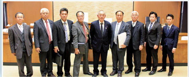
沖縄県中城村議会 (1月25日)