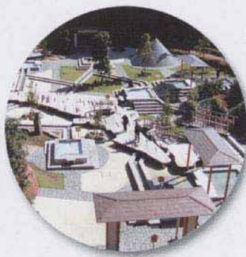
万葉公園足湯施設「独歩の湯」