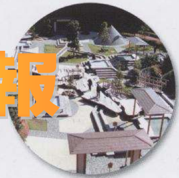
万葉公園足湯施設「独歩の湯」