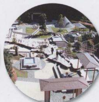
万葉公園足湯施設「独歩の湯」