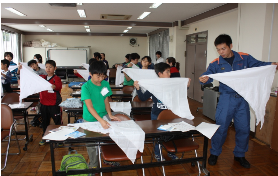
消防士さんから三角巾の使い方を教わりました