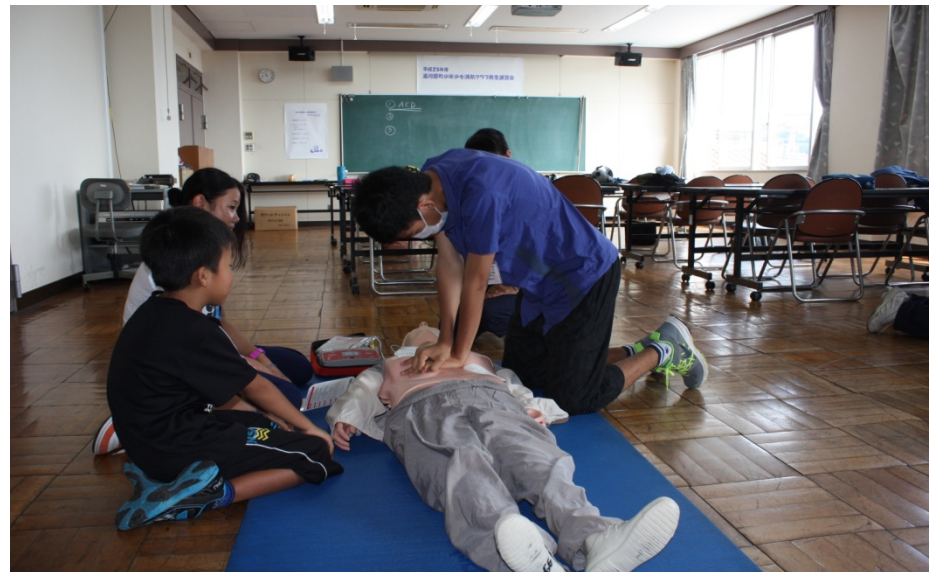
人形を使った心臓マッサージの練習