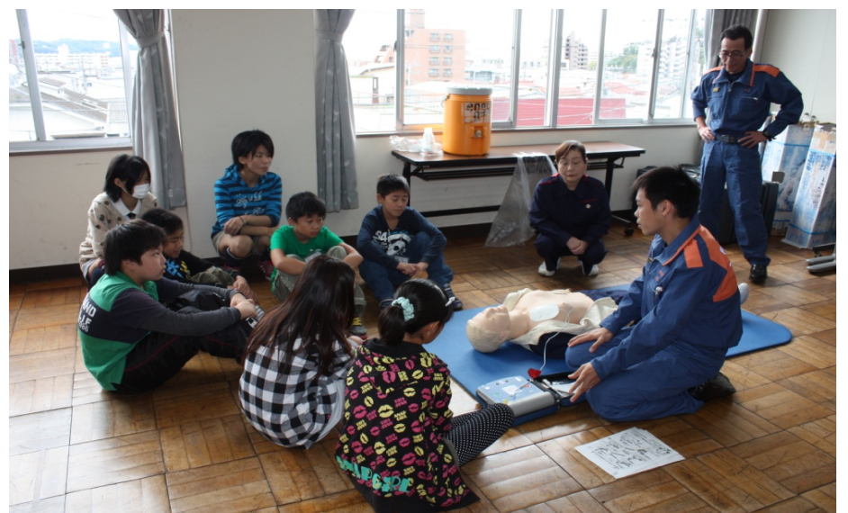
AEDの使い方を教わっている様子