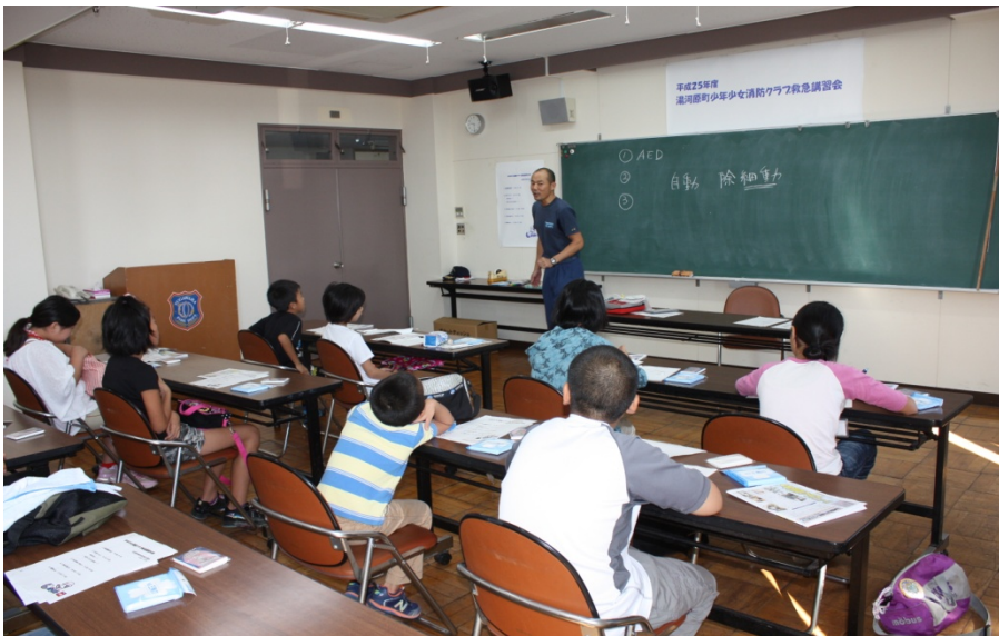
救命士さんからAEDについての説明を受けました