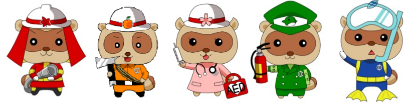
ゆたぽんファイブ消防バージョン

6月に発足した「湯河原町少年少女消防クラブ」では、平成25年10月5日(土)と6日(日)の2日間、約30人の参加者を2班に分け、湯河原町消防本部で救急講習会を開催しました。消防署の救急隊指導のもと、まずはAEDとはどんな機械なのか、AEDが湯河原町のどこにあるのかを教えてくださいました。