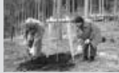
池峯「もみじの郷」植樹祭 「きれいなおみじになるといいですね。」