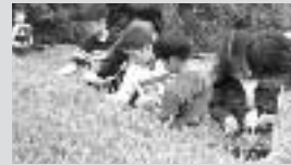
子どもふれあい農園事業 「お茶ってどんな料理になるのかな？」 「給食が楽しみだね」