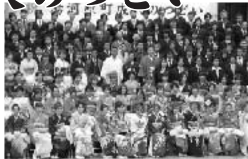
平成21年湯河原町成人のつどい