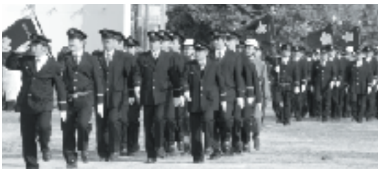
～消えるまで ゆっくり火の元 にらめっ子～