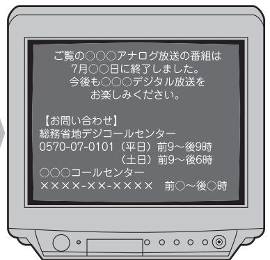
平成23年7月25日～ アナログ放送は映りません