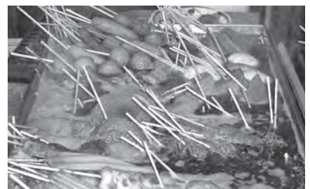
静岡おでん