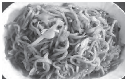
富士宮やきそば