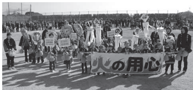
幼年消防クラブの演技