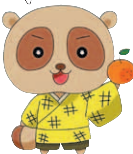
たん平 (10歳・♂) 楓太の同級生。おいしいものに目がない食いしん坊。担々やきそばとみかんが大好物。