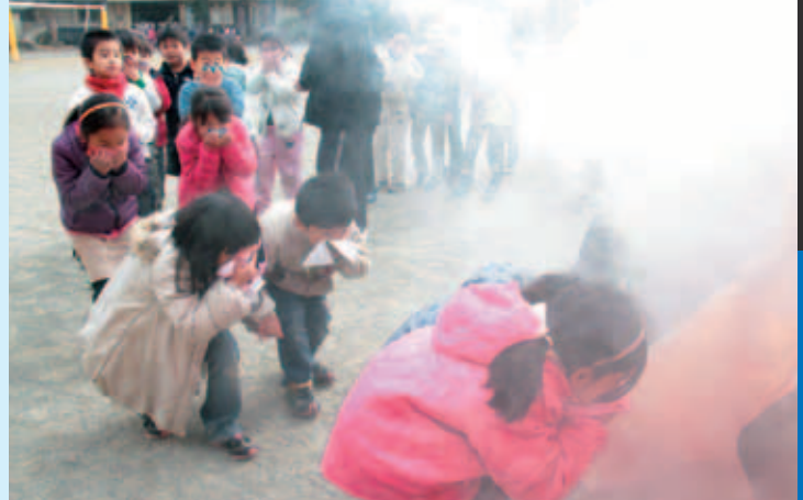
◆口と鼻をハンカチで押さえて姿勢を低く…。

ほかにも、こまを回したり、竹ぼっくりに乗ったりと、地域の皆さんとのふれあいを楽しみました。