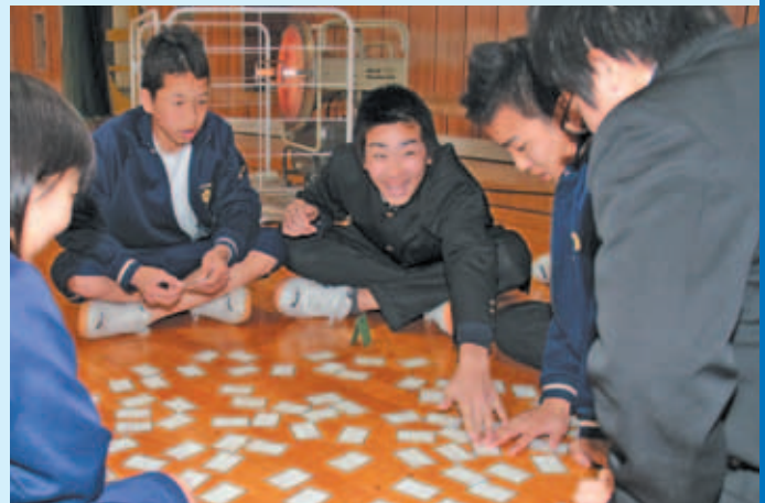
◆俺の方が先に取ったぞ!

いざという時には、もっとしっかり口と鼻をハンカチで押さえて避難するようにしましょうね。