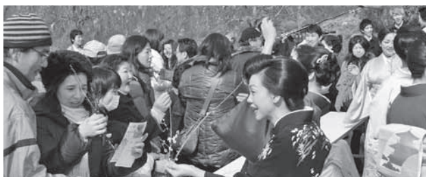
大好評のオープニングイベントでの『梅の小枝』の配布