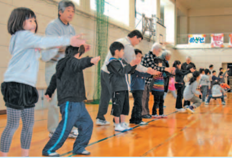
◆天井まで飛んで行け～!!