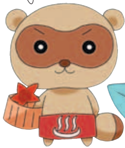
楓太 (10歳・♂) 三度の飯より温泉が好き。頭で考えるよりも体が先に動く熱血だぬき。