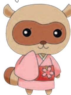
さくら (12歳・♀) 楓太の姉。温泉効果でお肌がツルツル。戦いよりもおしゃれに余念がない。