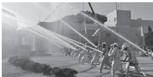
消防団・女性防火クラブ・消防署による一斉放水