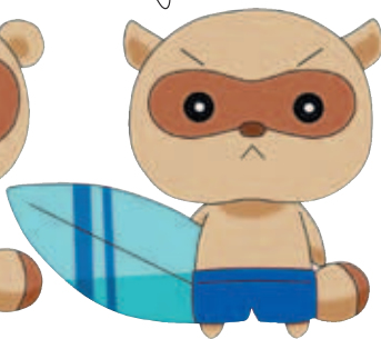
海人 (10歳・♂) 楓太の同級生。サーフィンが趣味のスポーツマン。ちょっぴりカッコつけなクールガイ。