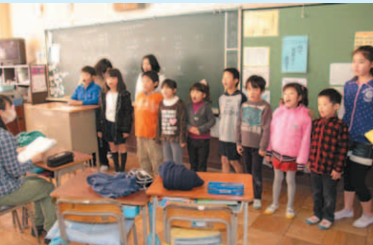
◆年ごと～、春ごと～、正しくも～♪♪