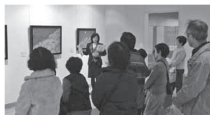
学芸員によるギャラリートーク