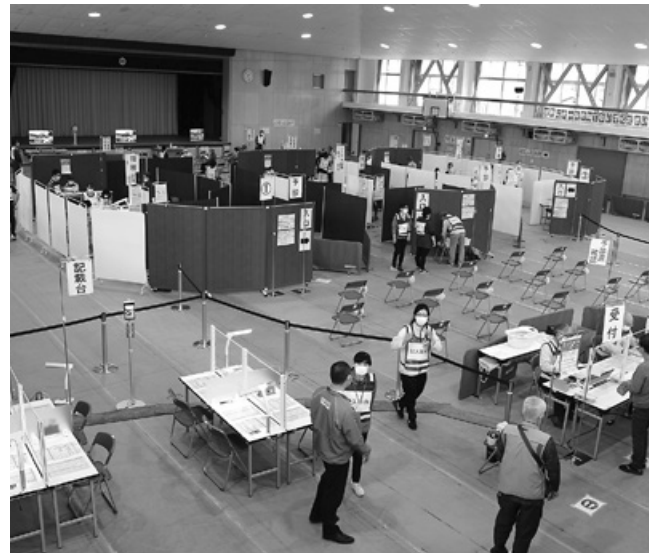
新型コロナウイルスワクチン接種会場（湯河原町民体育館）

今回の点検項目となる、令和元年度実施の事務事業について、外部委員からの学校教育から社会教育と幅広い分野における客観的な意見や評価がまとまり、報告を受けました。